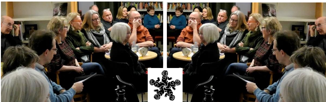
Världsberättardagen 2019.

På kvällen efter vårdagjämningens morgon firar vi Världsberättardagen på Världsbiblioteket med berättare från Berättarnätet Öst och Liv i Sverige!